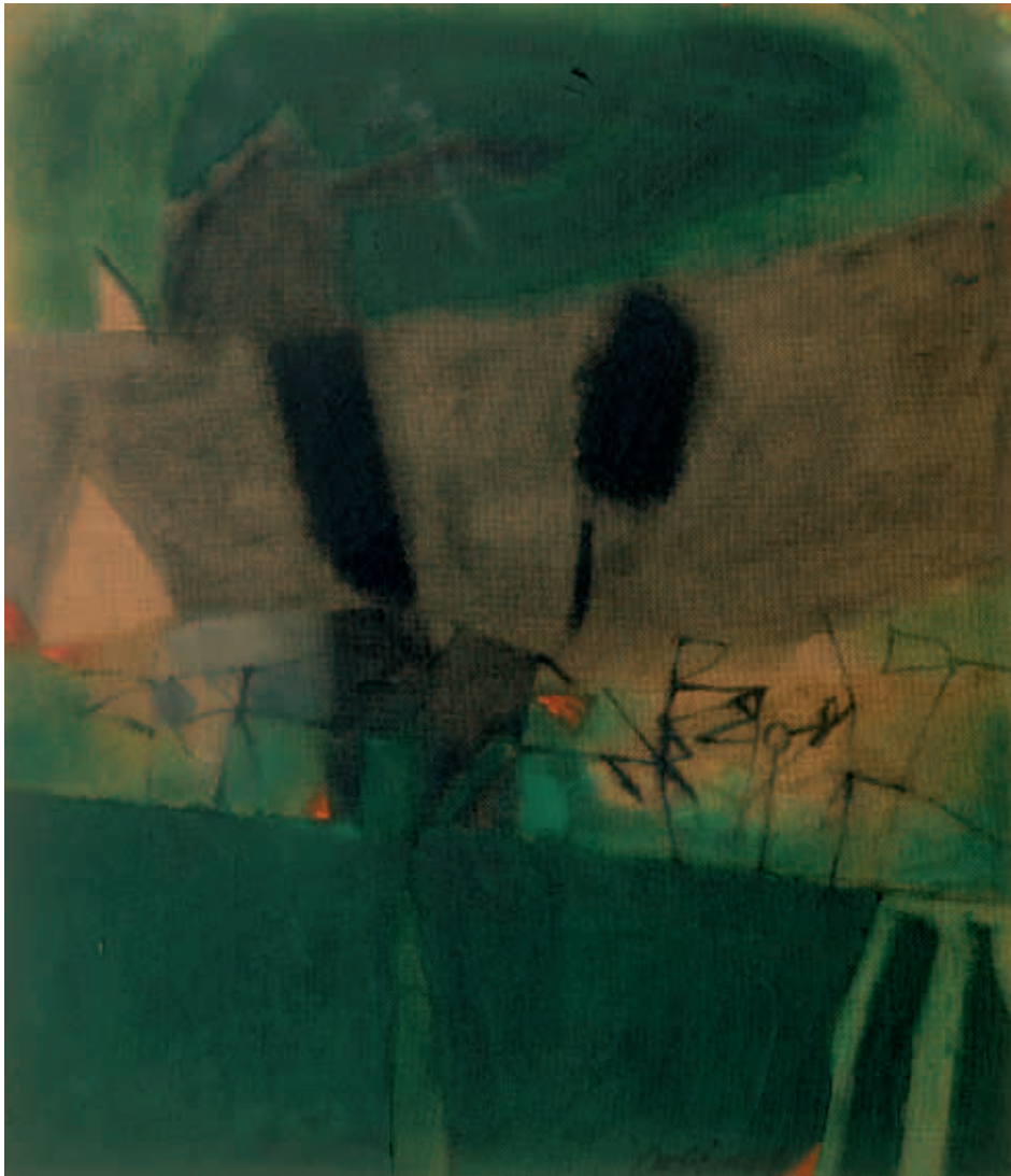
Fogliami alti e cupi olio su faesite, cm. 55,5 x 48, 2003